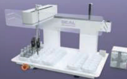
SEAL Minilab 1200